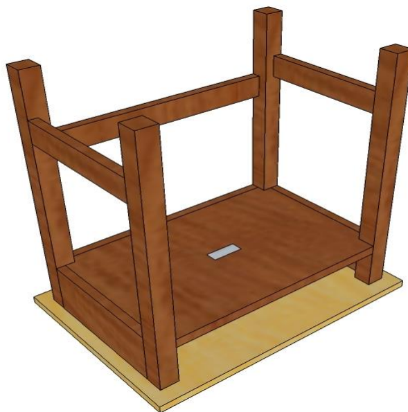
Rajah 3: Contoh penggunaan pelekat tanda pensijilan di bawah produk meja