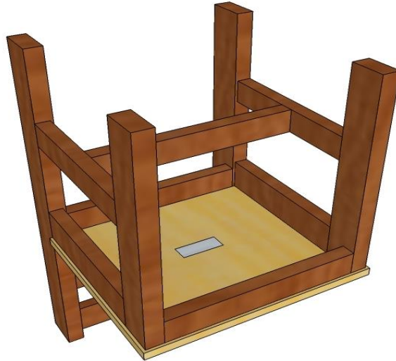
Rajah 2: Contoh penggunaan pelekat tanda pensijilan di bawah tempat duduk kerusi